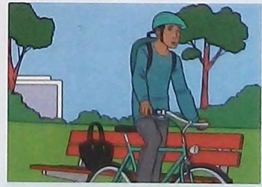
5 This is the young man ...