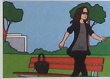
4 This is the handbag ...