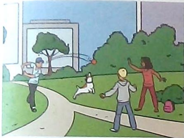
These are the kids → who were playing with their dog.

to her. But a small plane was flying over the park, so she couldn't hear him. At that moment, a man wearing a blue cap grabbed the bag and ran off. The cyclist tried to catch him, but the man ran into the bushes. While he was running away, he lost his cap.