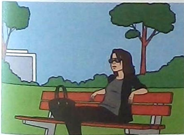
3 This is the woman ...