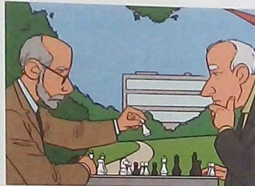
1 These are the men ...