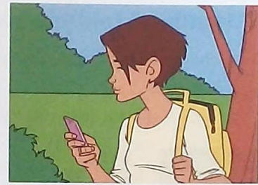
2 This is the girl ...