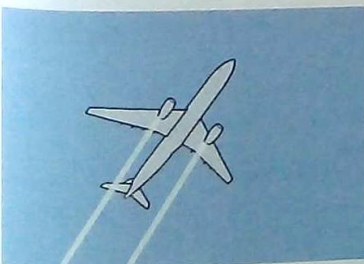
6 This is the plane ...