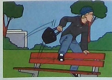
7 This is the man ...