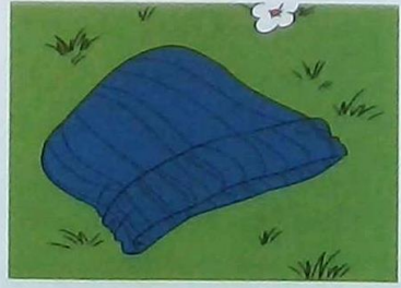
8 This is the cap ...